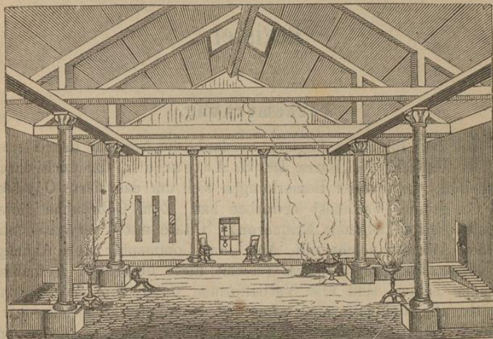
Perspectivischer Aufriss der hinteren Hälfte des Männersaals im Palaste des Odysseus.

(aus Autenrieth's Wörterbuch zu den Hom. Gedichten).